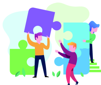
designed by freepik (Bild von freepik)