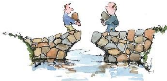
By Frits Ahnfelt